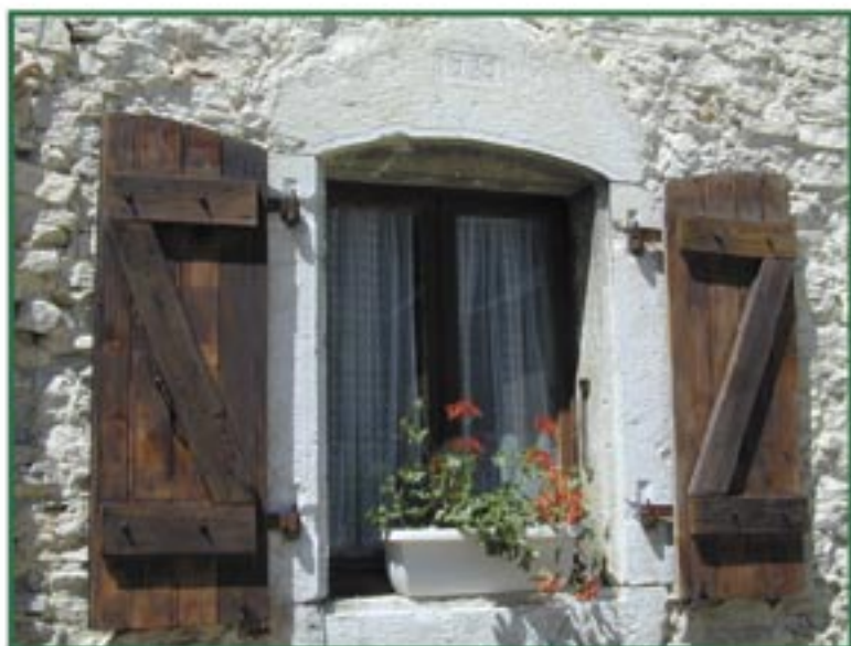
Domaine de Piache 1780

Ouvrez la fenêtre et venez la découvrir !